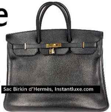
Sac Birkin d'Hermès, Instantluxe.com

de 700 à 1 400 euros. Les marques tendance se retrouvent souvent plutôt sur Videdressing . Grand choix de pièces Chloé, Maje, Sandro, mais on peut aussi tomber sur une jupe Balenciaga à 175 euros ou des escarpins Marc Jacobs.