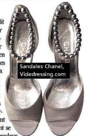
Sandales Chanel, Videdressing.com

Qui dit luxe et petits prix dit souvent contrefaçon. Pour la combattre, le site Instantluxe fait certifier par des experts les objets mis en vente. eBay donne quelques conseils : bien vérifier la fiabilité du profil du vendeur, ne pas hésiter à lui